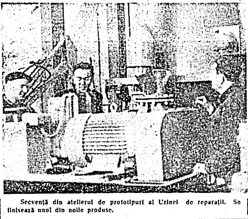
Secvență din atelierul de prototipuri al Uzinei de reparații. Se finalizează unul din noile produse.