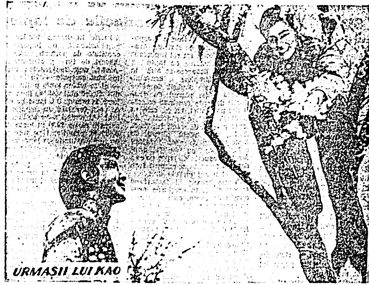
URMASII LUI KAO

Filmul „Urmașii lui Kao” care rulează pe ecranele cinematografului „Tineretului” este o adaptare după romanul „Familia”, a marelui scriitor chinez Pa-kin. El redă viața a patru generații dintr-o familie de moșieri care trăiesc într-un oraș pe malul fluviu-