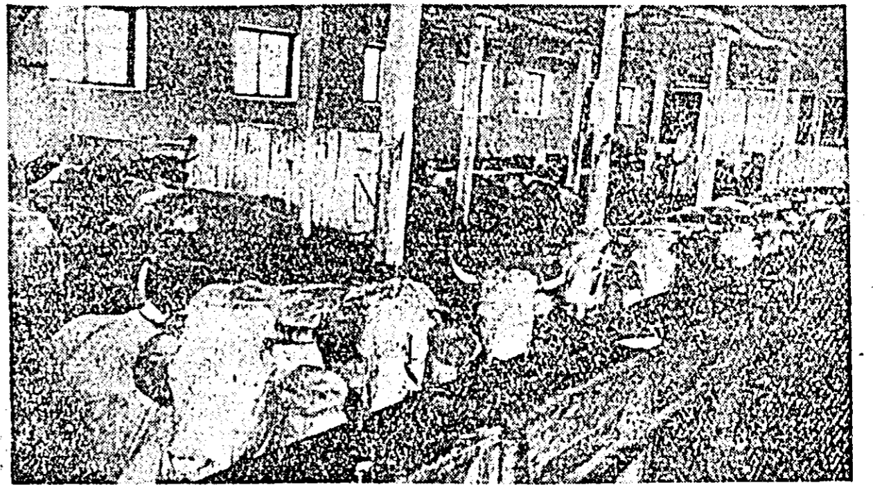
Aspect interior al unuia din grajdurile secției Aradul Nou a G.A.S. Aradul Nou.

Cu toate realizările frumoase obținute în ce privește creșterea producției globale de lapte și a producției de lapte marfă, producția de lapte planificată pe anul acesta pe cap de vacă furajată n-a fost realizată. De asemenea prețul de cost al unu litru de lapte este mai mare decât cel planificat. Nerealizarea planului în ce privește producția de lapte pe cap de vacă furajată se datorește furajării nerăționale, cîștării și în timpul verii, cînd posibilitățile de furajare sînt mult mai mari. Depășirea prețului de cost se datorește și faptului că furajele produse în gospodărie s-au realizat la un preț de cost mai mare.