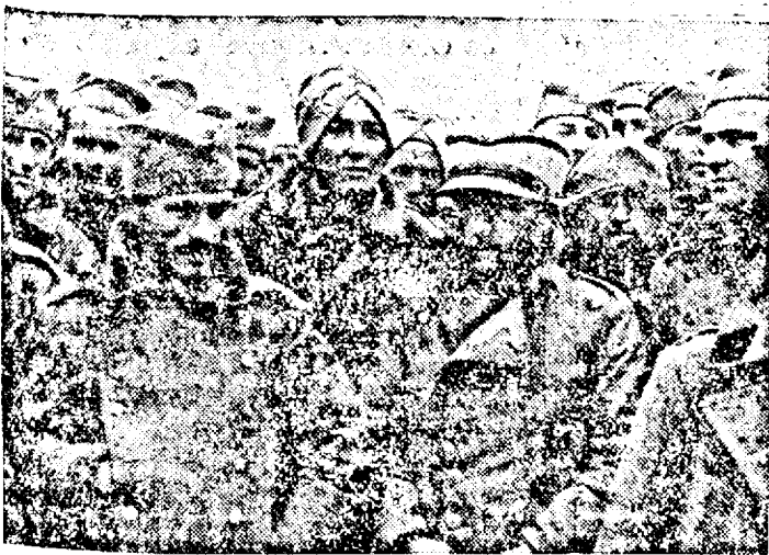
Primii prizonieri sârbi stau încă sub impresia puter- nicilor atacuri ale trupelor germane, care i-au capturat.