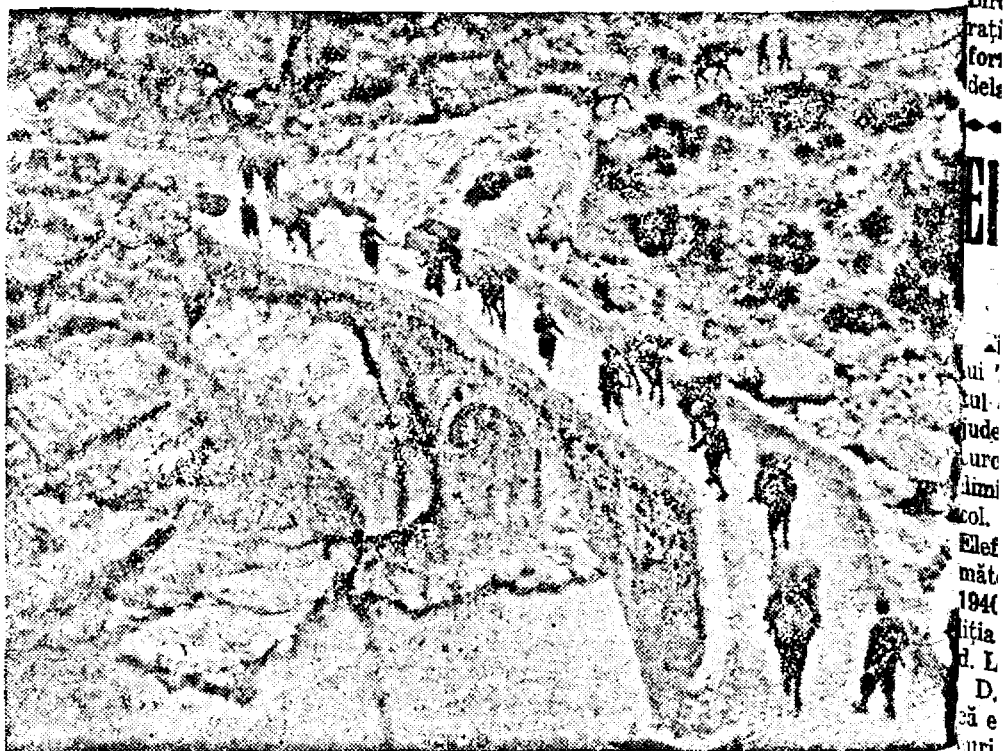
Coloană Italiană pe frontul greco-albanez.