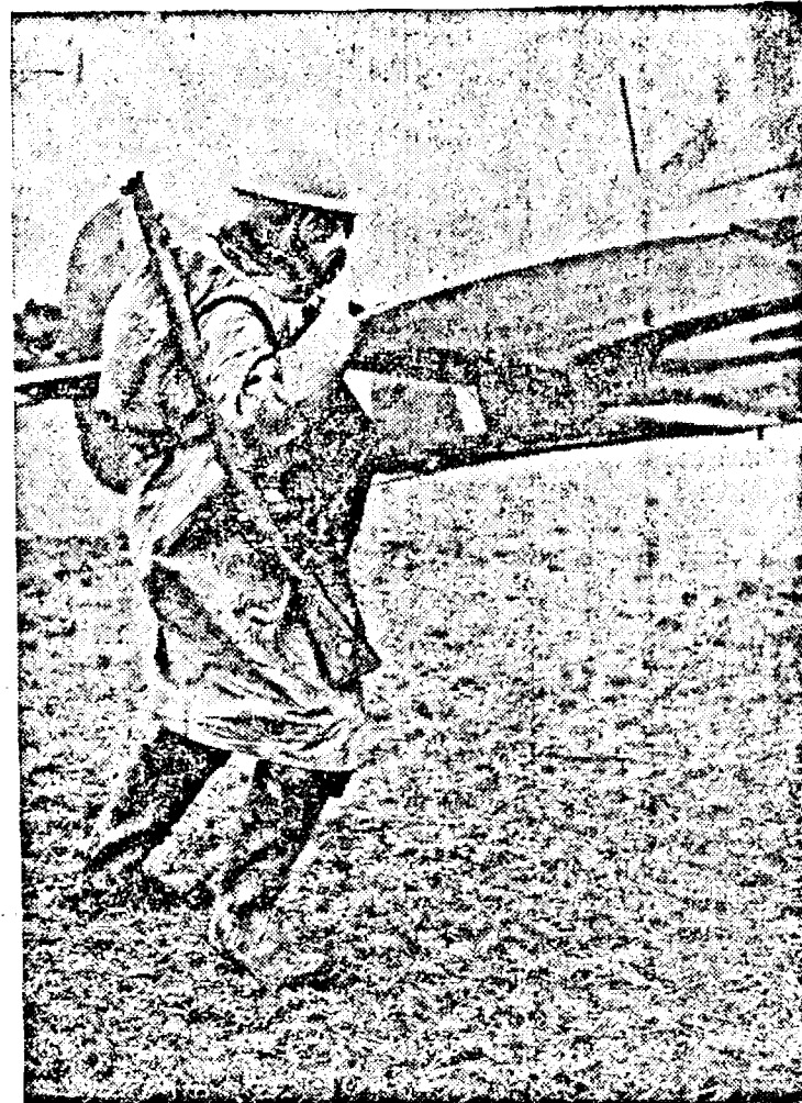
Soldat britanic, în timpul alarmei îndreptându-se cu masca de gaz spre un avion pentru a-l ajuta la decoiere.