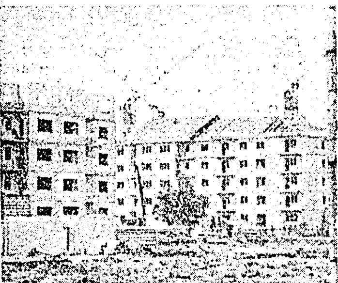
Arad. În construcție noi blocuri de locuințe în zona „Alfa”.

Așteptăm cu nerăbdare să începem să punem în funcțiune a primul bloc.