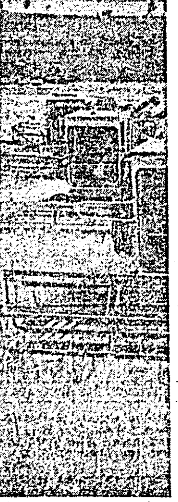
Seceris 31.