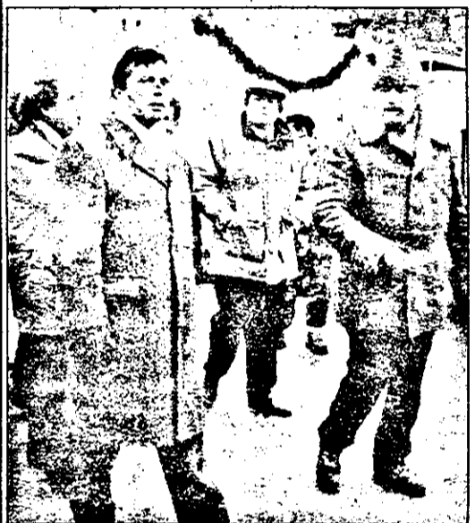
O parte din delegația Aradului prezintă la manifestările dedicate Zilei de 1 Decembrie.

În calitate de gazdă, primul care a luat cuvântul la Tribuna oficială, a fost primarul municipiului Alba-Iulia. Discursul președintelui Iliescu a început pe fondul huiduielilor multîmii, urmate însă imediat și de aplauze. Șeful statului român nu s-a lăsat intimidat, nici chiar de spaima trasă de gărziile de ordine, în momentul apariției pe plaușul din fața Tribunei oficiale, a unui nevinovat câine maidanez. Problema s-a rezolvat însă foarte repede, sus numitul câine având inspirația să dispară la căldură, adică printre picioarele soldaților. Vrând probabil să dea o replică pancartei aflate în fața dânsului și pe care scria „Sau pumnul în pieptul furtunii sau vom pieri” (Avram Iancu), dl. Iliescu a afirmat: „opoziția inventează câteodată (ca și acum) tot felul de pretexte, care de fapt denotă lipsa dorinței de participare la astfel de manifestări. Lipsa de conciliere”