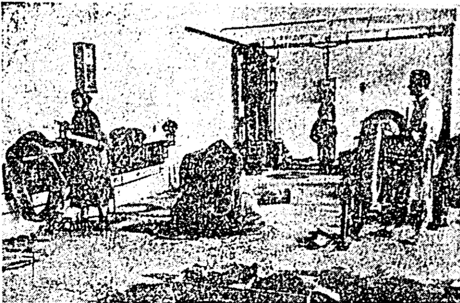
În vederea unei mai bune deserviri a populației, întreprinderea orășenescă de industrie locală a deschis în ultimul timp două noi ateliere, unul de vulcanizare și altul de mase plastice.

ÎN CLISEU: un aspect din noul atelier de vulcanizare al întreprinderii IOIL.