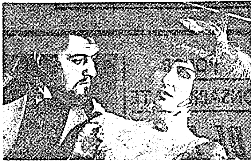
Secvență din piesa „Unchiul Vanea”.