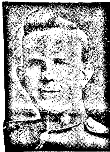
General O'Duffy, der Führer der Bereinigten Irlandpartei und der irischen Blauhemden-Organisation, ist überraschend zurückgetreten. Eine Erklärung über die Gründe seines Schrittes zu geben, hat er abgelehnt.

Obige Tatsachen sollen ein warnendes Fingerzeig für unsere vernachlässigte Schulpolitik sein. Für die Zukunft muß darauf Gewicht gelegt werden, daß entweder die Diplome der konfessionellen Lehrereparanden dieselbe Gültigkeit erlangen, wie die Staatsdiplome, oder man muß dafür Sorge tragen, daß unsere Junglehre neben ihrem nicht anerkannten konfessionellen Lehrerbildung sich auch das Staatsdiplom beschaffen. Da der größte Teil unserer Lehrer ansonsten stellenlos bleibt und zum Nichtstun verurteilt wird.