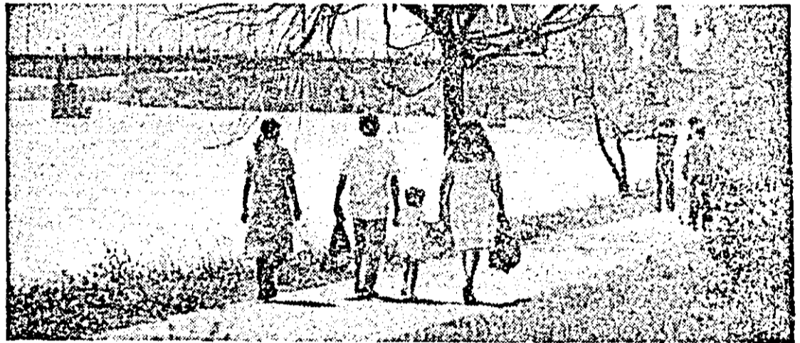
Ilustrată ardeeană.