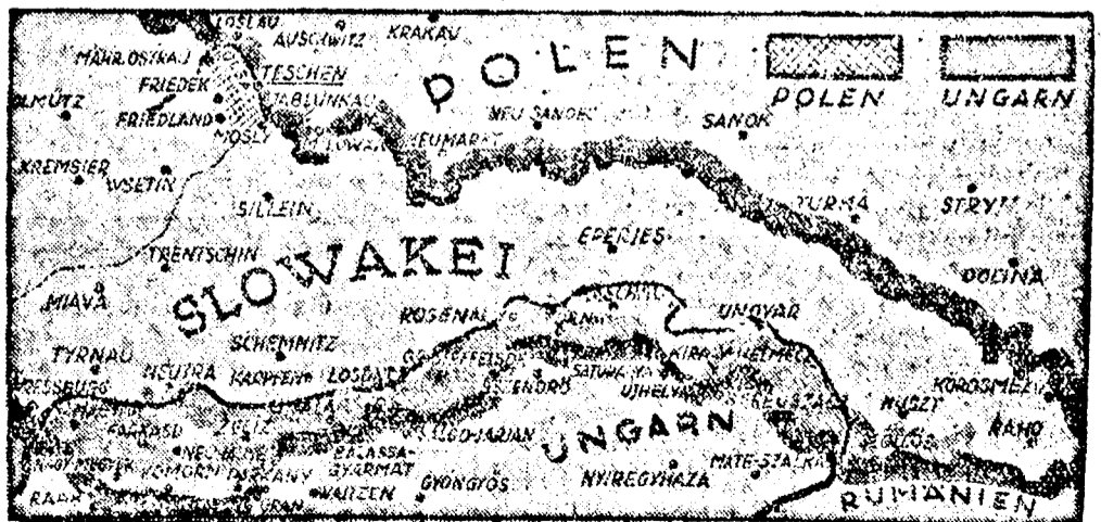
Mit kapott Magyarország

A budapesti délutáni lapok jelentése szerint megtörtént a megállapodás az érdekeltek között Pozsony új helyzetére nézve és eszerint ott Németország, Lengyelország és Magyarország szabadkikötőt létesíthet és ezáltal Pozsony nemzetközivé válik.