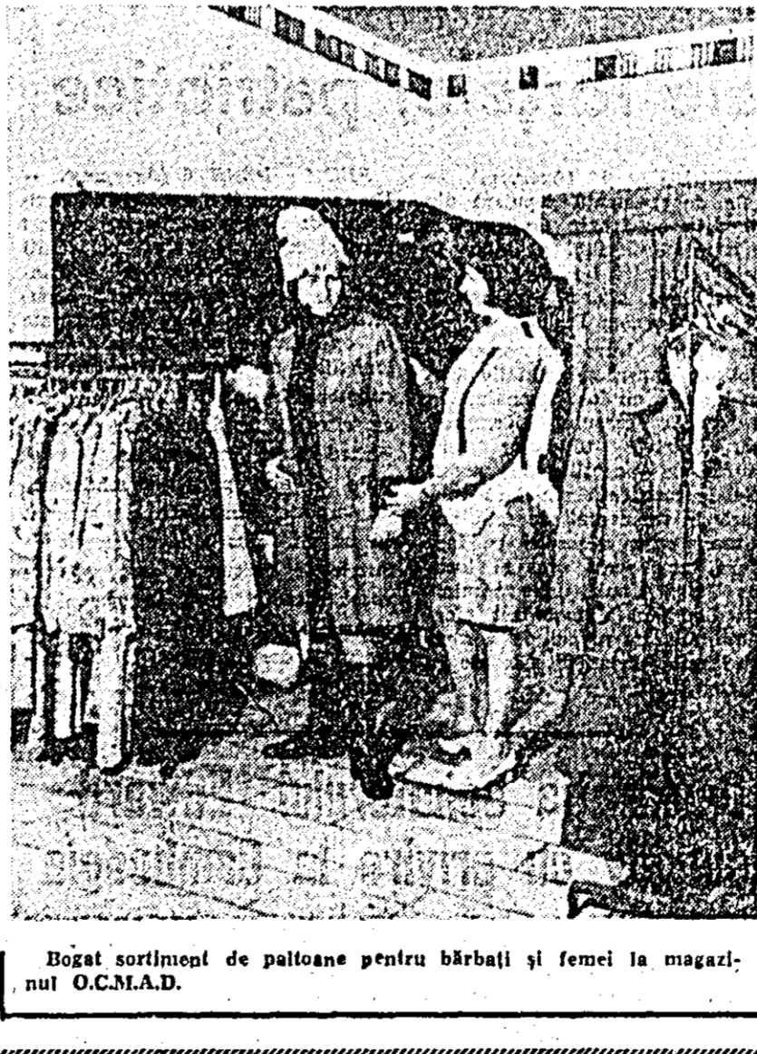
Bogat sortiment de paltoane pentru bărbați și femei la magazinul O.C.M.A.D.