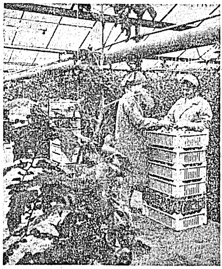
La I.A.S. „Sere” recoltatul roșilor e în tol.