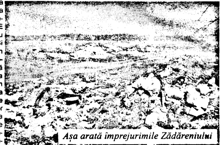
Așa arată împrejurimile Zădăreniului

de la începutul anului în curs, preluăm gunoii de la gospodăriile localnicilor cu o căruță, iar ei plătesc pentru aceste servicii 50.000 lei/an. În rest, avem alocate 800 de milioane de lei pentru pietruirea unor străzi, chiar mâine (n.n. astăzi) organizând o licitație pentru achiziționarea materialului necesar. Pe raza comunei avem două gropi de gunoi...De curățarea șanturilor trebuie să se ocupe sătenii... Cu cei 30 de asistați sociali reușim să curățăm văile...”, afirmă primarul Cismaș.