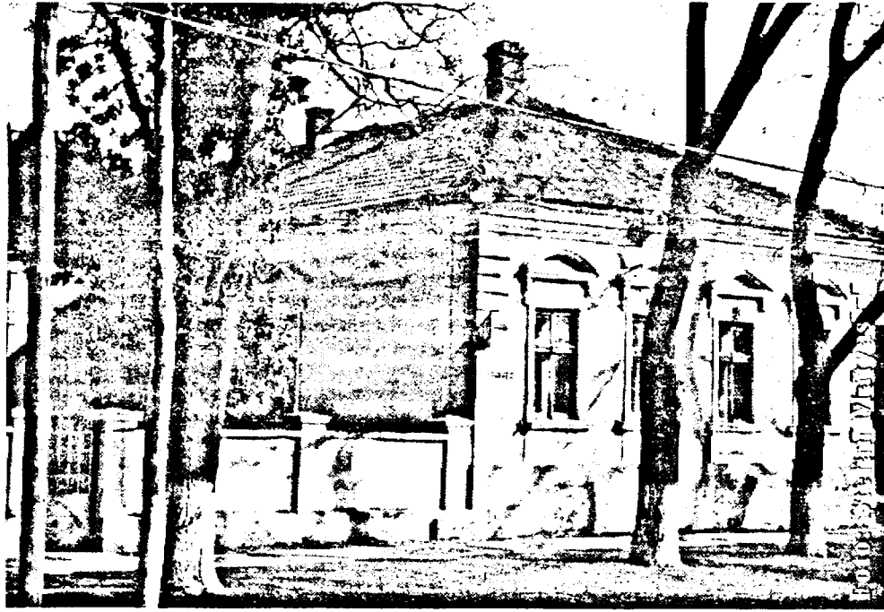
Viitoarea clădire a Primăriei

conțează numărul populației și perspectivele demografice. Dosarul care a ajuns la Parlament a conținut toate argumentele necesare pentru votul favorabil legii de înființare a noii unități administrative.