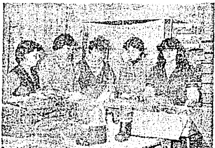
Cizmulețele pentru copii produse la întreprinderea „Arădeanca” se bucură de o frumoasă apreciere din partea beneficiarilor. În fotografie: aspect din atelierul ambalaj.