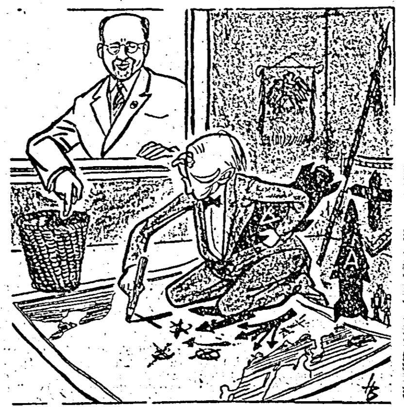
W. ULBRICHT: — Aruncă în coșul pentru hirtii planurile de expansiune spre Răsărit, domnule Adenauer! (Desen din ziarul „Neues Deutschland”)