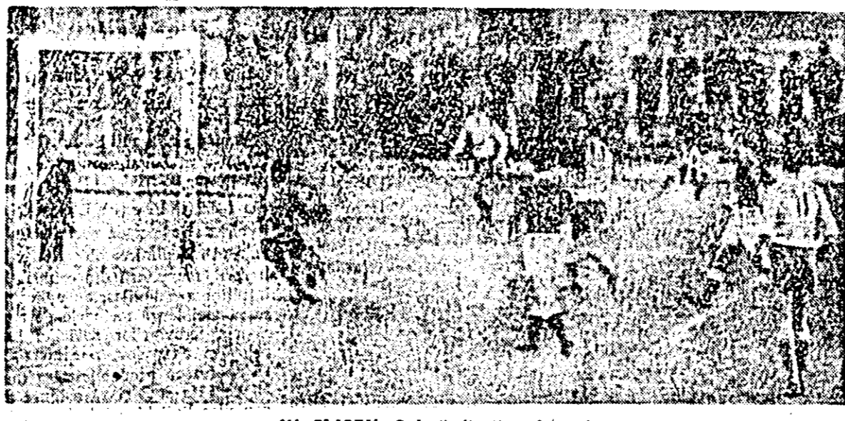
ÎN CLIȘEU: O fază din timpul jocului.

(Urmare din pag. 1-a) conștința muncitorilor brutari. După cum se vede, roadele nu au înfriztat să se arate. Brigadierii și meșterii, dau acum și ei dovadă de mult simț de răspundere. Cu conștințiozitate lucrează și laboranții și nu rare sunt cazurile când poate fi văzut prin secții, în toată nopțile, chiar tov. Augustin Moga directorul întreprinderii. Uneori, cel drept desuș de rar, se întâmplă ca un necaz. Așa de pildă, muncitorii din secția V-a au livrat pline albe de calitate mai slabă, din cauza cuporului care a fost deteriorat. Desigur că această defecțiune, deși a fost