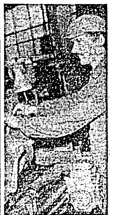
Comunistul Ovidiu Tanislav, strungar la sectorul II al întreprinderii de vagoane se bucură de o frumoasă apreciere în colectivul său de muncă.