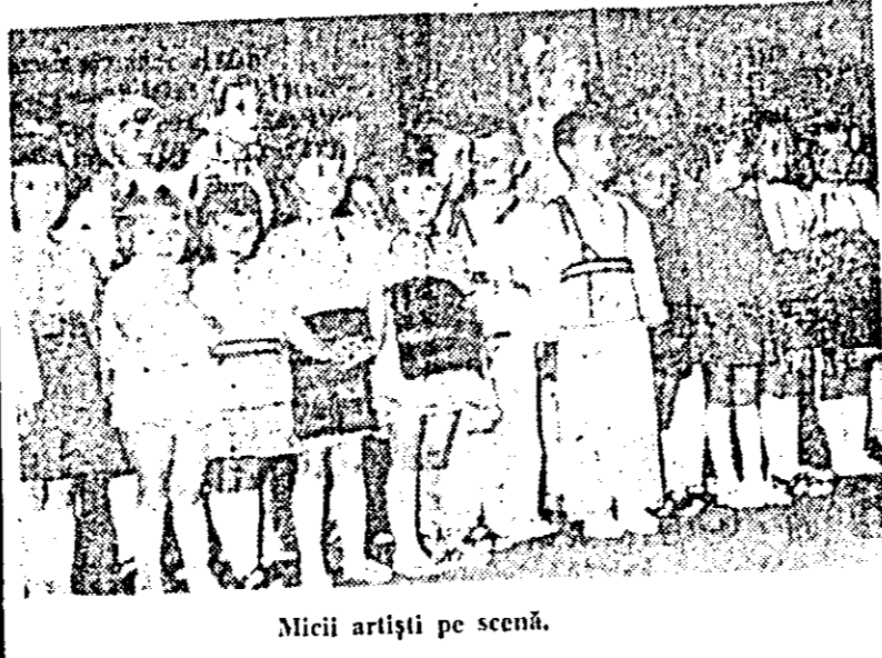
Micii artiști pe scenă.

Recent, în sala culturală „Nicolae Bălcescu“ din cartierul Sincolaș, grupă mare și-a luat rămas bun de la educatoare, de la grădiniță, un program artistic susținut de Programul a conținut cîntece, poezii prin care copiii au adresat cuvinte de laudă pentru tovarășele educatoare care au dovedit multă dragoste și pasiune în îngrijirea și educația lor. V. MOTOCEA