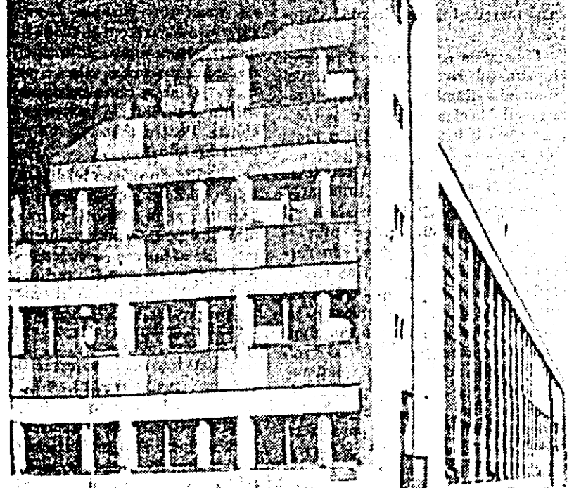
Aspect exterior al sectorului II — Uzinele de vagoane.