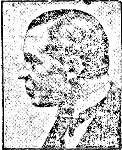
VANSITTARD angol külügyi államtitkár

A stresai konferenciának tulajdonított nagy jelentőségre jellemző, hogy évszázadok-