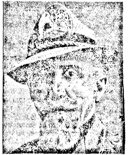
EMILIO DE BONO

Párisból jelentik: A „Paris Soir“ Abessziniába kiküldött munkatársa igen érdekes beszélgetést folytatott De Bono tábornokkal, az Abessziniában összevont olasz haderő parancsnokával. A lap munkatársa azt a kérdést intézte a tábornokhoz, hogy közölje véleményét az abessziniai helyzetről. A tábornok a következő választ adta: — Az Abessziniában tapasztalható nyugalanság teljesen közömbös előttünk. Olaszország