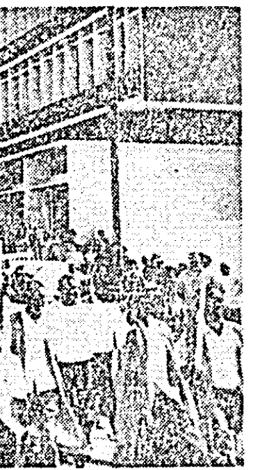
TANZANIA. În ultima vreme s-au înregistrat în această țară o serie de acțiuni care se înscriu pe linia așa-numitei „tanzanizări” — a stabilirii controlului statului asupra economiei naționale și a asigurării unor condiții de viață mai ridicate maselor de tanzanieni.

LONDRA 24 (Agerpres). — Guvernele Maltei și Marii Britanii au anunțat că au ajuns la un acord cu privire la organizarea unor noi tratative la Londra consacrate soluționării crizei intervenite între cele două țări în urma hotărârii Angliei de a reduce efectivele sale staționate pe insulă.