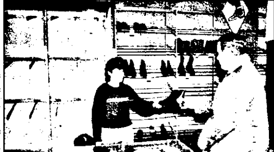
Hălmăgiu, magazinul universal, raioul încălțăminte. Dacă am rămâne doar la oferta cooperativei, ar trebui să umblăm desculți.

Firește, cele patru sate sunt legate cu centrul de comună prin drumuri județene. Unele mai bune, altele proaste sau foarte proaste. Ca să ajungi, mai ales toamna, iarna sau primăvara cu Dacia în aceste sate, e o adevărată aventură. O spunem, pentru că am trăit-o. Oful localnicilor e că legături de autobuz nu sunt decât între Hălmăgel-Luncoșoara și Hălmăgel-Sârbi.