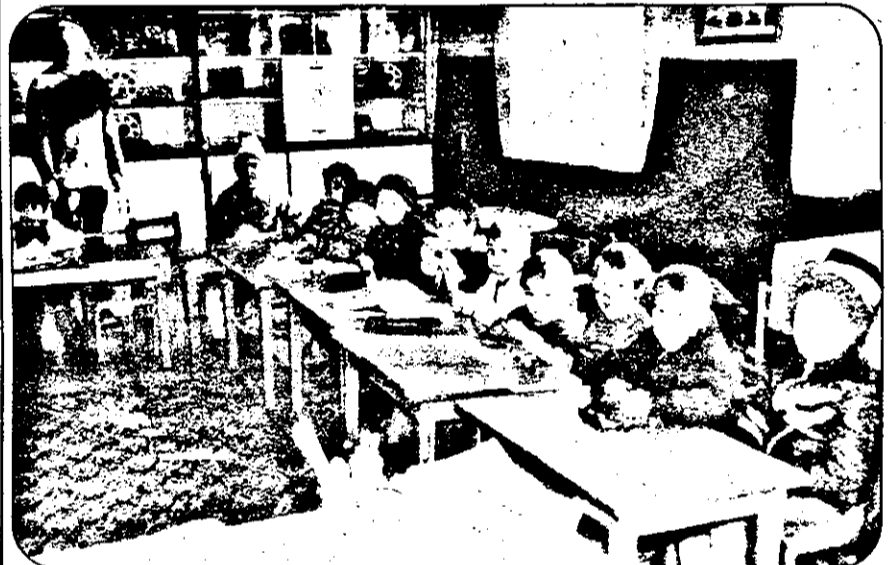
La grădinița din Vârfurile, copiii se pregătesc să devină... școlari.