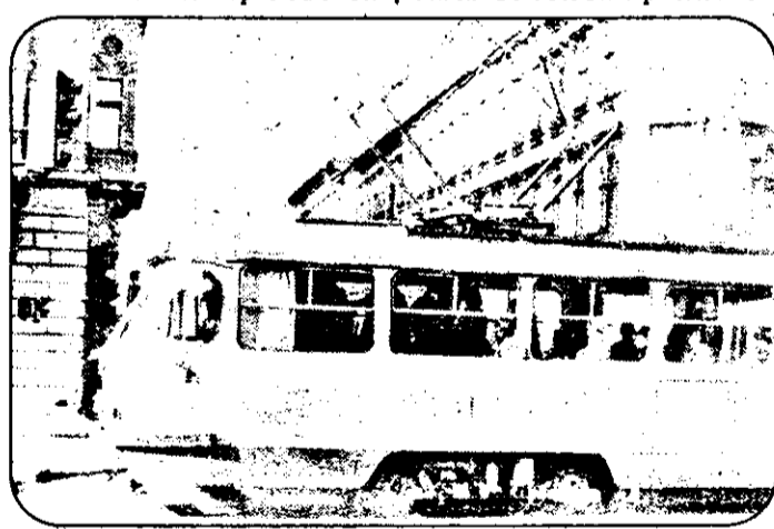
Tramvaiul din imagine poartă sigla cunoscutului producător de vagoane din Arad. Dar SC ASTRA SA este și firma care recondiționează caroseriile tramvaielor care circula în municipiul nostru.

lei, sumă din care au fost achitate cheltuielile pentru refacerea liniei în centrul municipiului, au fost plătite obligațiile contractuale față de ASTRA și au fost achiziționate 30 autobuze (cinci noi). Achiziționarea acestor autobuze a avut ca scop extinderea activității regiei noastre în zone care, din diverse motive, nu mai sunt deservite de întreprinderea