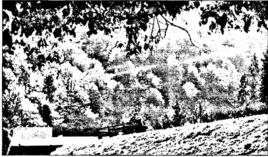
Moneasa - un loc feroce pentru vacanța fiecăruia.

Creatura avea aproximativ 6,5 metri lungime, adică jumătate din dimensiunile celebrului său urmaș, Tyrannosaurus Rex.