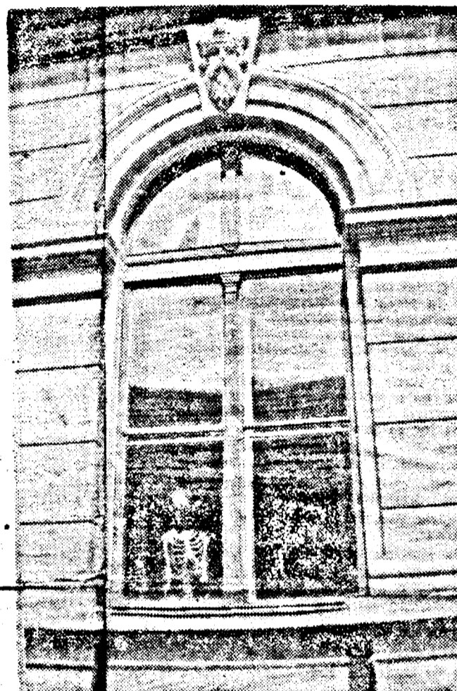
VIITORUL REPUBLICII PREZIDENTIALE PINDEȘTE DIN UMBRA

Aceste prevederi și altele, atribuții mai mari și mai largi decât cele prevăzute de Decretul-Lege 92/1991, cum ar fi cele prevăzute de art. 90 — dreptul președintelui de a face referendum cu privire la probleme de interes național, probleme nespecificate, art. 92 — președintele este comandantul forțelor armate și președinte al Consiliului Suprem de Apărare (parcă am mai auzit de aceste funcții la noi) ar putea duce la tentații pe un președinte cu aspirații de unic conducător. Toate țările eliberate de dictatură — Italia, după dictatura