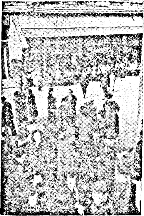
După ocuparea Parisului: Cele mai noi ziare sunt împărțite Parizienilor.