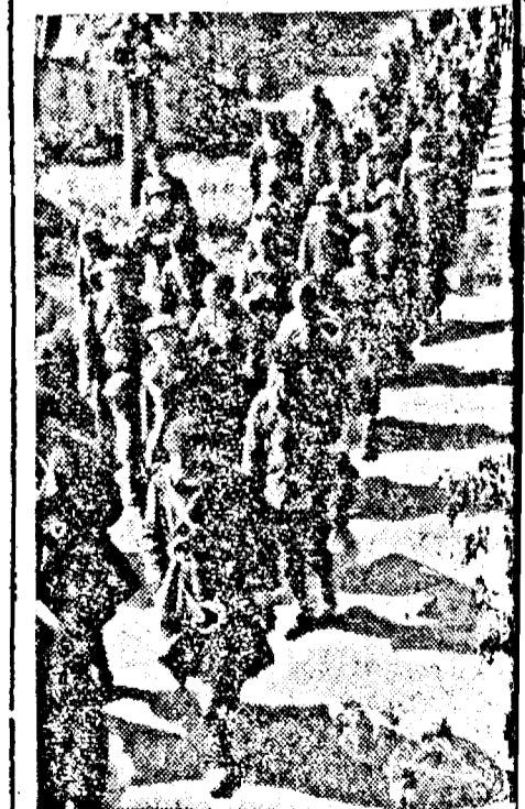
Prizoneri din luptele dela Rein.

Newyork, 6. (Rador) — Corespondentul agenției DNB transmite: Ziarul american publică lungi corespondențe dela trimișii lor la Berlin, care au la parte la călătoria la Hamburg, pentru a se convinge că știrea engleză privitoare la completa distrugere a orașului Hamburg de către aviația militară germană este completă falsă. La Hamburg nu se văd urme de distrugere. Portul și șitulul Elbei sunt intacte. Ziaristii americani precizează că șanțierile dela Bichimet Vooss nu sunt deloc distruse.