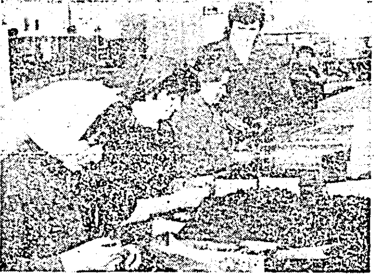
Aspect de muncă în secţia a III-a a întreprinderii de articole metalice pentru mobilă şi binate Arad.