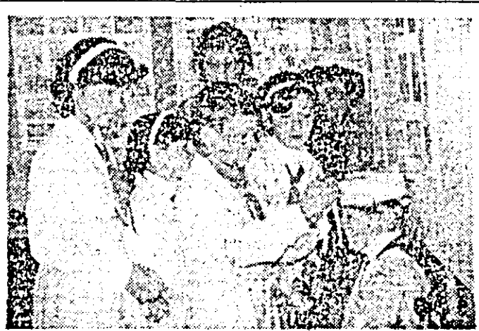
La C.P.S.P. Arad s-a desfășurat zilele trecute faza zonală a concursului pionieresc „Sanitarul priceput”. În imagine, echipajul Școlii generale din Vinga.