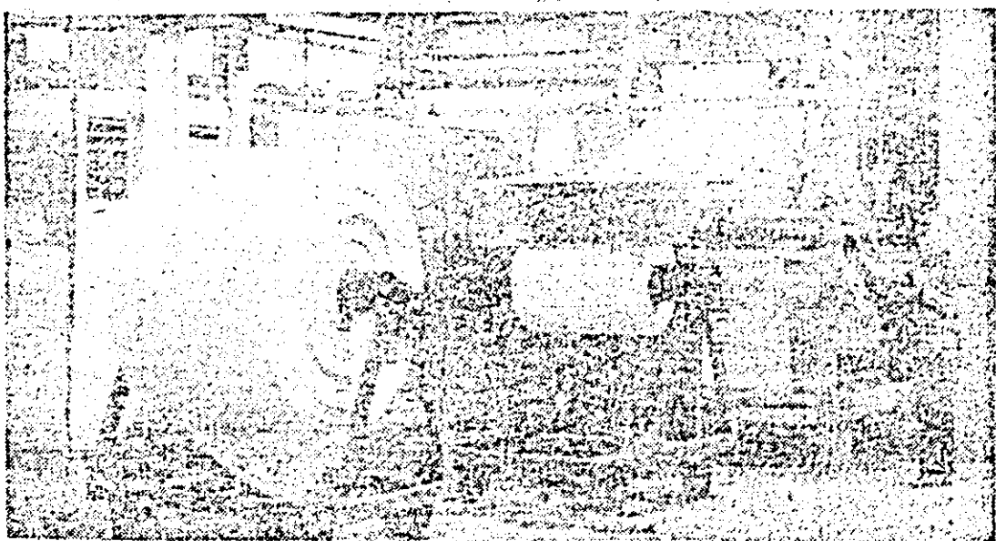
Aspect de muncă în secția albitorilor a întreprinderii textile.