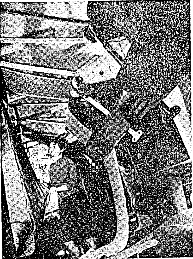
Fabrica Teba: La rampa de control a căii