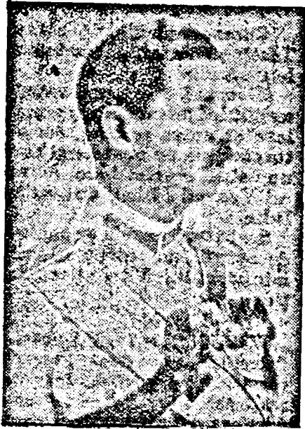
M. S. Regele CAROL al II-lea

tate și de voie bună, către Măria Sa Marele Voevod Mihai, de Alba-Iulia, noi adăugăm sentimentul de grațitudine și de admirație care inbujează fie-