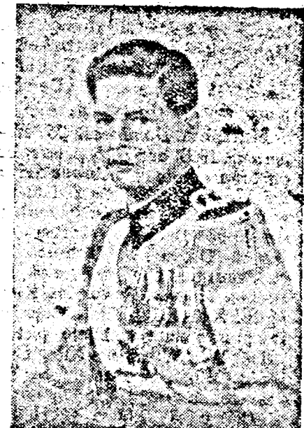
MĂRIA SA MIHAI Marele Voevod de Alba-Iulia

tindenți, se va putea desluși mai bine cât de prețuită este, în țară, osârdia, virtutea, noblețea cu care Marele Voevod poartă calitățile al căror singur moștenitor și păstrător va fi, într-o zi.