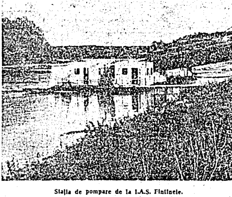
Stația de pompare de la I.A.S. Flăiești.