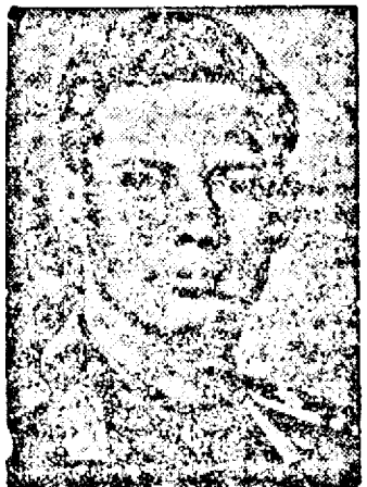
M. S. REGELE MIHAI

unea Sovietică și marile puteri, printr-o acțiune de avantajii, care au asigurat mișcarea economică a țării noastre.