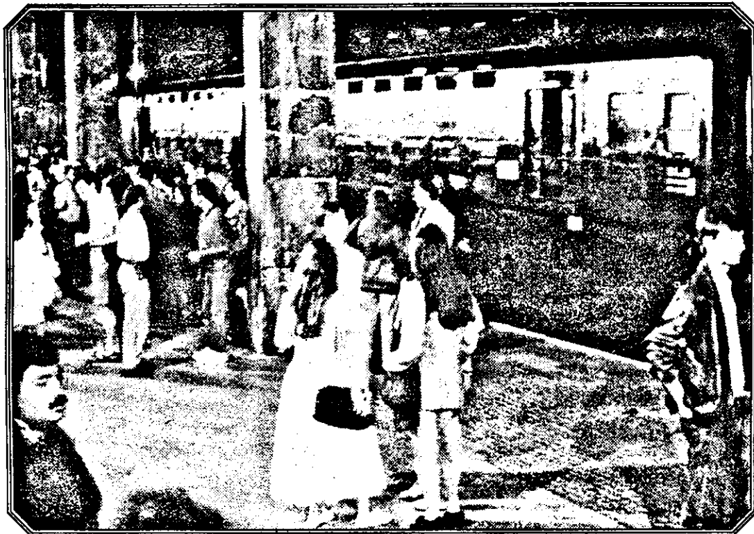
Până la urmă trenul a trecut, dar pe linia a...nouă.

Prima investiție germană în industria arădeană de confecții