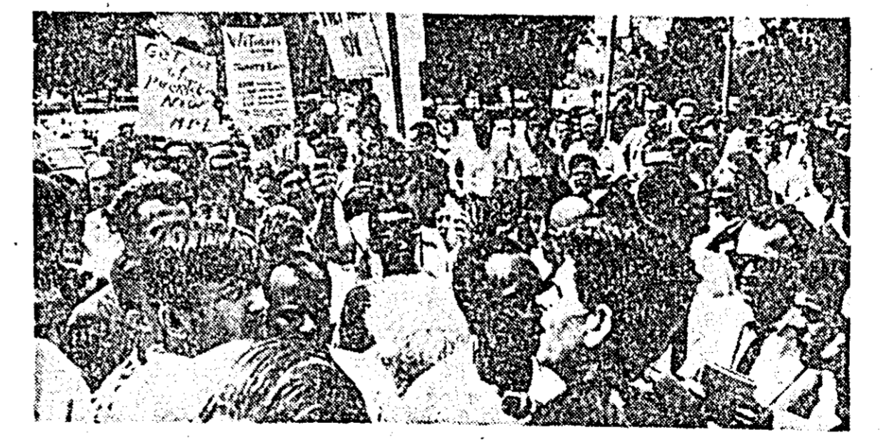
S.U.A. — Demonstrația tinerețului din Yale împotriva politicii agresive americane din Vietnam și împotriva staționării trupelor S.U.A. la Santo Domingo.

SANTO DOMINGO. — În Republica Dominicană au încetat lucrul 18.000 de muncitori portuari. Greva afectează activitatea a 11 porturi.