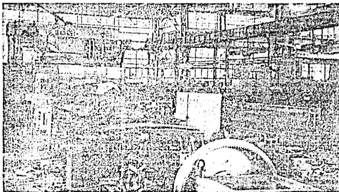
Aspect general din secția de strunguri grele de la I.M.U.A.