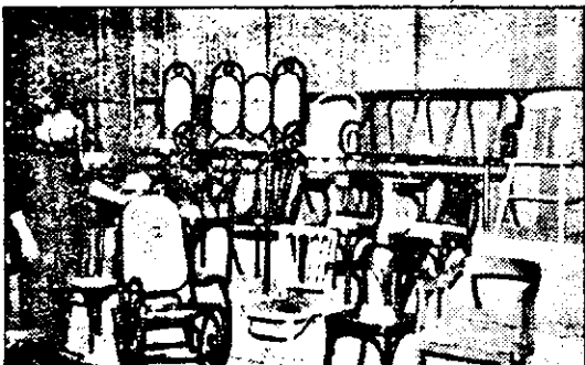
Scaunele „made in Pâncota” costă între 60.000 - 70.000 lei bucata. Aspect din expoziția fabricii.