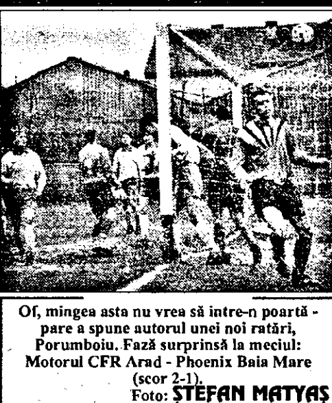
Oi, mingea asta nu vrea sa intre-n poarta - pare a spune autorul unei noi ratari, Porumboiu...