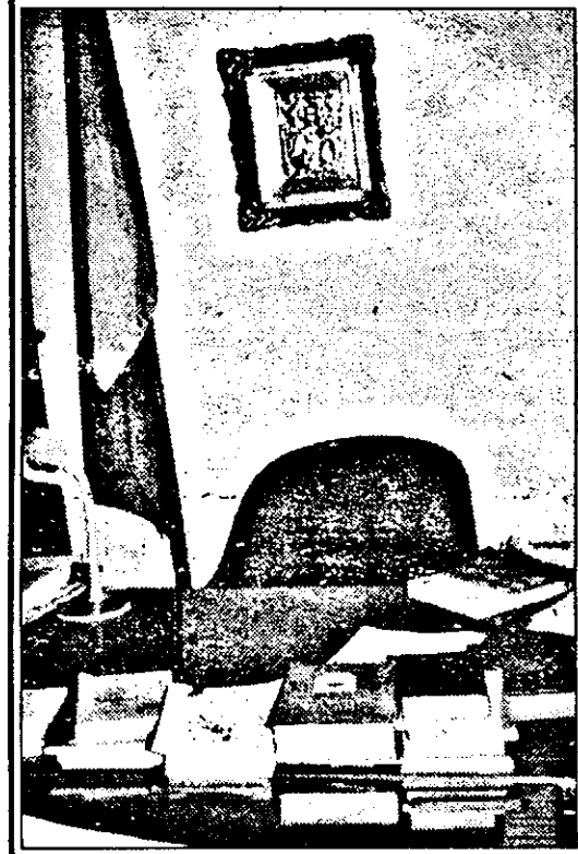
Scaunul primarului. De patru ani acesta a fost mai mult gol, spun pâncotanii.

Problemele din Pâncota nu ne erau străine. Ca o confirmare, pe adresa redacției noastre a sosit o scrisoare, în care erau expuse mai multe chestiuni arzătoare din „orașul cocorilor”. Erau amintite