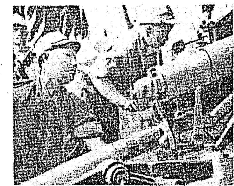
R.D. VIETNAM: Servanții tunurilor anti-aeriene de veghe.

Salutind pe înaltul oaspete, E. Ochab a subliniat că vizita președintelui Franței constituie pentru Polonia și Franța un important eveniment politic. "Polonia și Franța, a spus el, sînt unite prin vechi legături de prietenie și colaborare. De-a lungul veacurilor, popoarele noastre au luptat în repetate rânduri umăr la umăr pentru idealurile comune umaniste ale libertății și progresului."