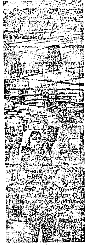
Aspect din secția tricolaje a întreprinderii "Tricolour roșu".