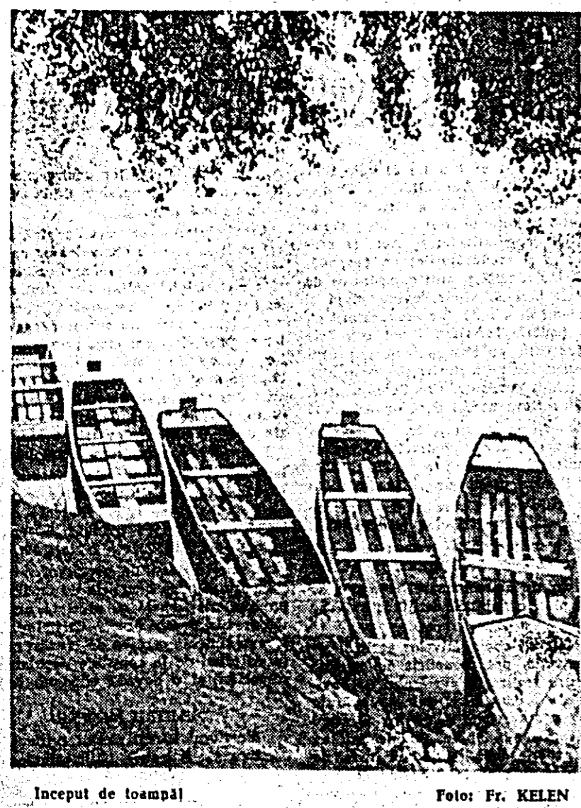
Început de toamnă.

ANUNȚĂ ÎNSCRIERII la următoarele cursuri: — CURSURI INTENSIVE DE LIMBI STRĂINE: ENGLEZĂ, GERMANĂ, FRANCEZĂ, ITALIANĂ. — CURS DE CITIRE RAPIDĂ. — COSMETOLOGIE. — STENOGRAFIE. Inscriserile se fac zilnic între orele 10-13 și 18-20 în B-dul Republicii nr. 78 etaj I. Informații telefon 1-67-13.