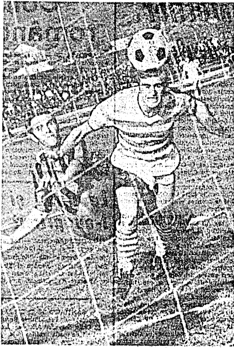
Sima înscrie pentru UTA golul egalizator.