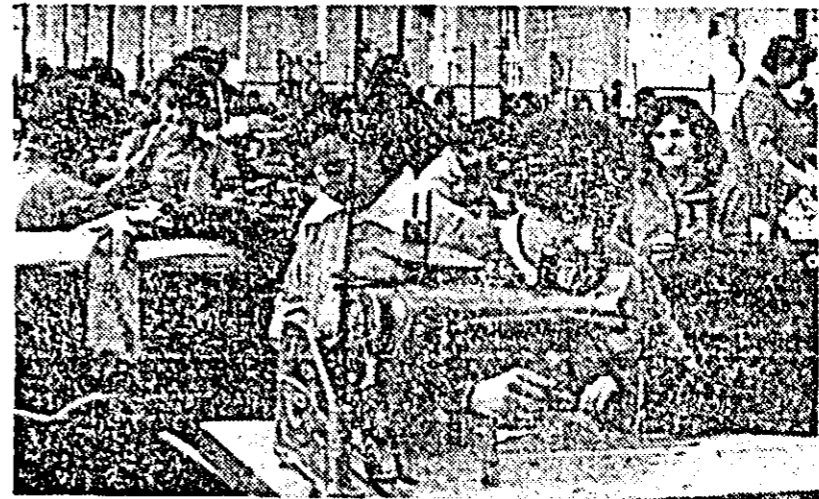
La Fabrica de confecții Arad, miini îndeminatele produc îmbrăcăminte pe gustul cumpărătorilor.

Începutul de an pune în fața conducătorilor de întreprinderi, a colectivelor acestora, numeroase probleme a căror rezolvare depinde în mare măsură de priceperea cu care se fac cei dintâi pași, de calitatea planificării acțiunilor, de consecvența urmării și controlului pe tot parcursul desfășurării acestora. Și cum la ora actuală nici drumul spre știința organizării nu este încă un drum asfaltat, biroul Comitetului județean de partid, prin comisia sa economică, a inițiat în aceste zile o constatare cu conducătorii întreprinderilor industriale din județ, la care au participat activiștii obștești ai comisiei economice, cabinetul județean de organizare științifică, precum și colectivele care coordonează problemele de organizare științifică în întreprinderi. Referatul expus de comisia economică, conținutul programului de activitate prezentat de cabinetul județean de organizare științifică, discuțiile participanților, precum și îndrumările multilaterale date de tovarășul Dumitru Bordea, secretar al Comitetului județean de partid, au constituit un răspuns competent la întrebarea: „Cum acționăm, acum la început de an, pe linia organizării științifice a producției și a muncii?”