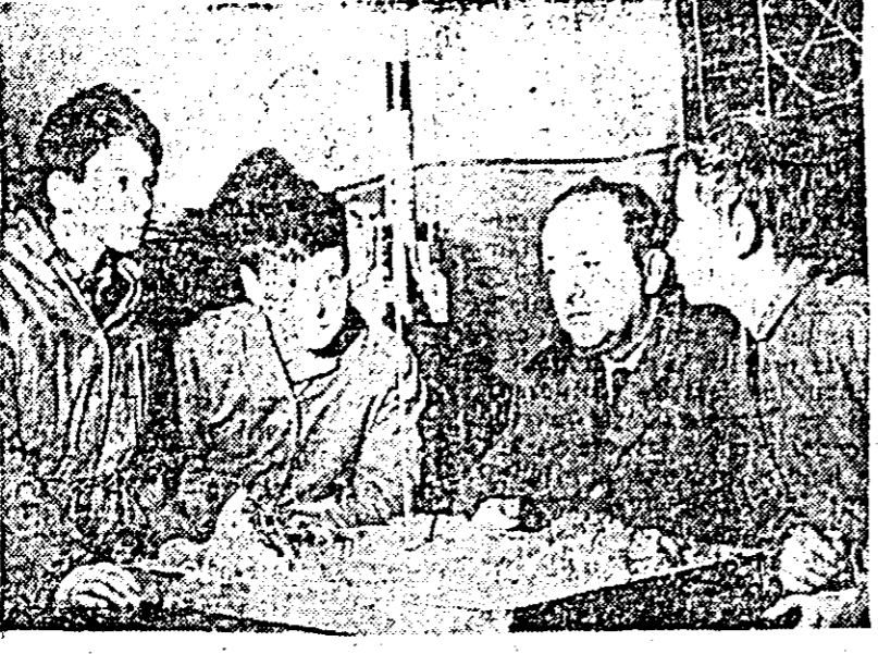
Viitorii constructori de rachete