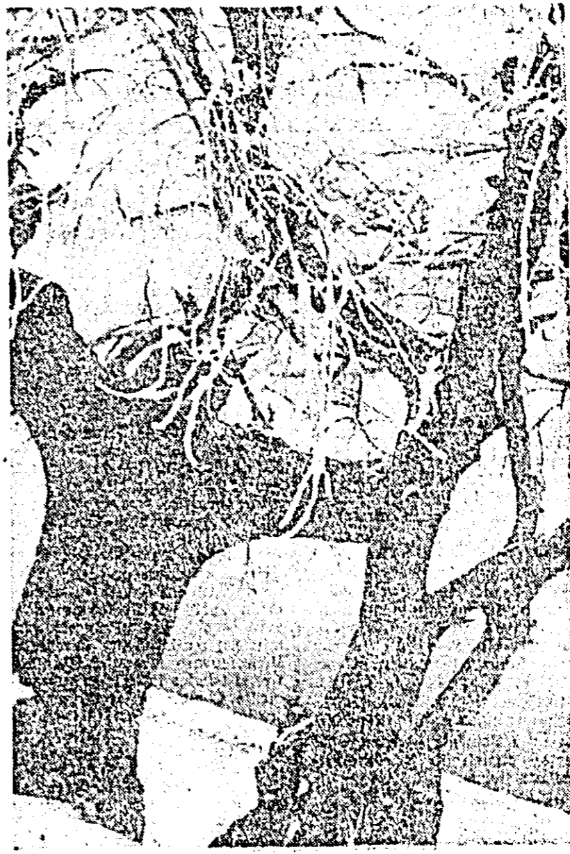
Iarnă în parcul de pe malul Mureșului

susține podul casei, într-un loc pe care nu-l știe decît gospodarul, e săpat un loc tainic aici veghează, pentru orice eventualitate, un apărător sigur împotriva celor ce ar cutega să fie prădătorii gospodăriei: pistolul. Copiii, pînă nu vor căpăta minte de înțelepți, nu vor ști ce ascunde grînda casei. În ambele odăi sînt așezate la locul cuvenit o seamă de lucruri săvîrșite de mîinile minuni ale paneli Floare. Cu furca, războiul, acul și suveica că a împlut ca-