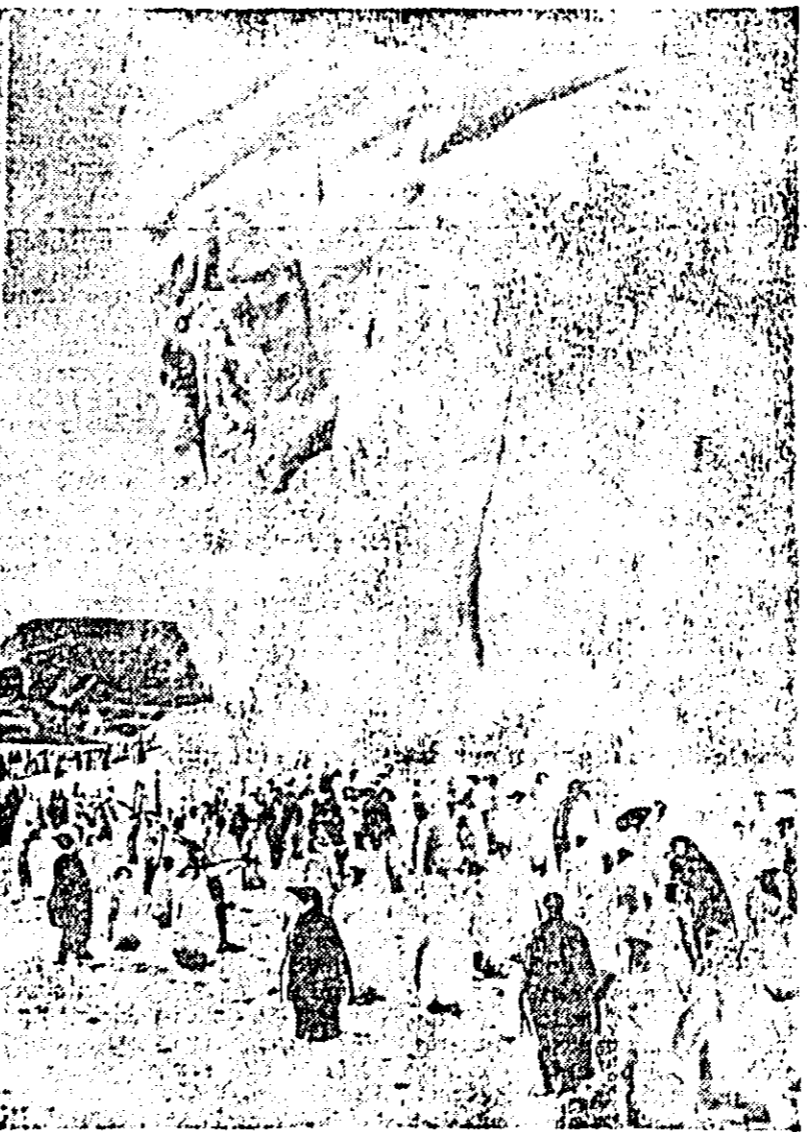
Pinguini imperiali care trăiesc în colonii uriașe hrănindu-se cu pește și animale marine.