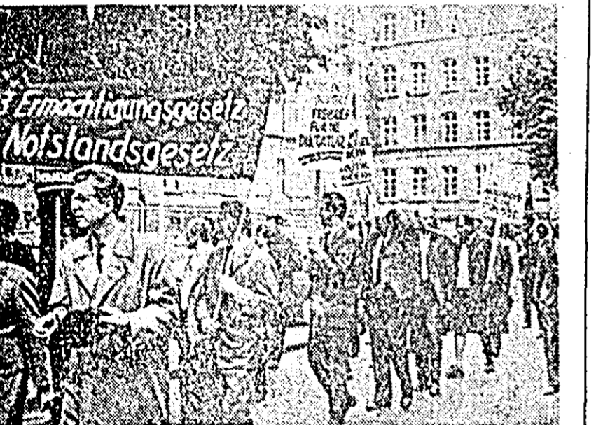
In 1933 legea impunerii taxelor excepționale. In 1963 legea stării excepționale. Sub această lozincă sute de muncitori vest-germani din Reinhausen au participat la un marș de protest...