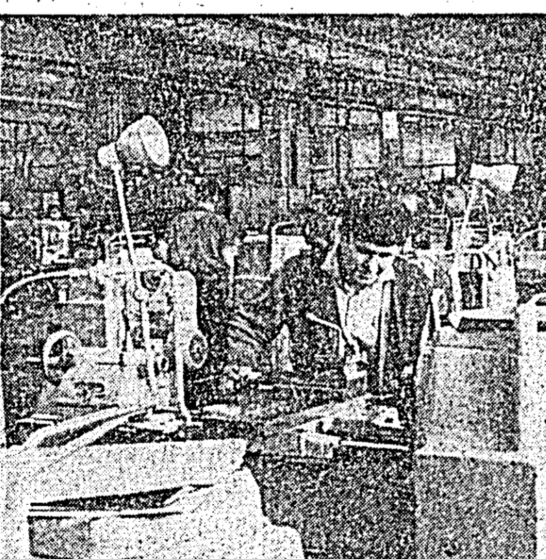
Aici prind contur strungurile românești. În secția montaj piesele se grupează supuse în subsansamble și corpuri care treptat, treptat conturează strungul. IN CLISEU: aspect din hala secției montaj.