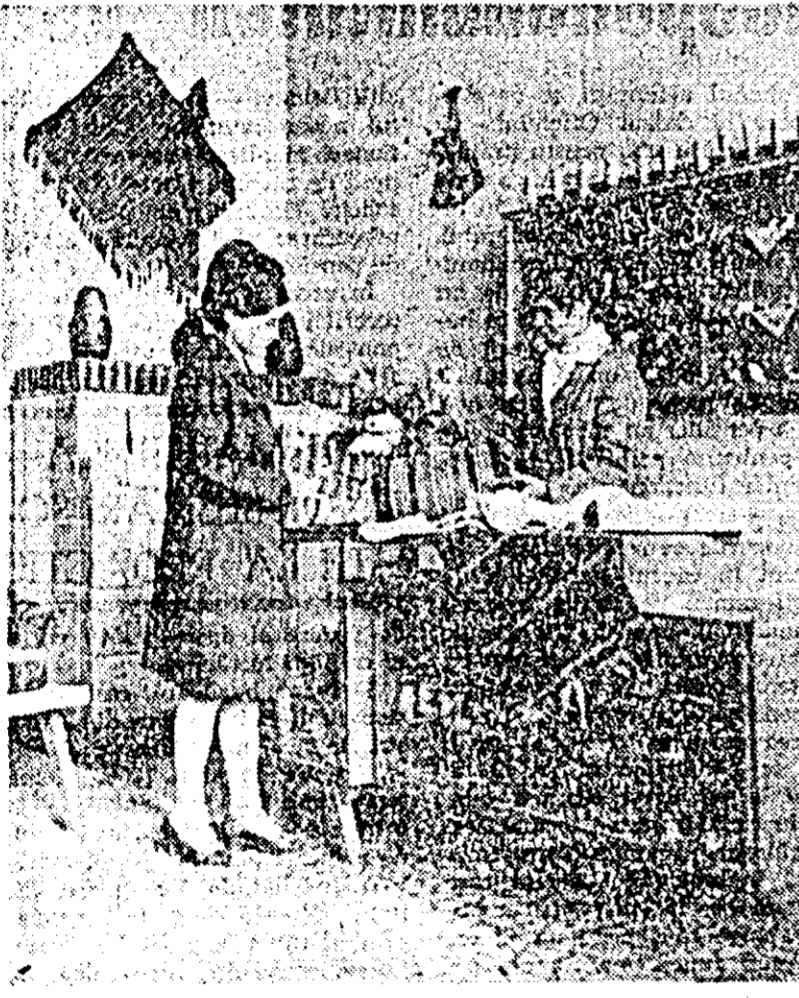
Un loc frecventat atît de localnici cît și de turiști: Magazinul artizanat din Piața Avram Iancu.

IN IMAGINE: aspect din interiorul magazinului.