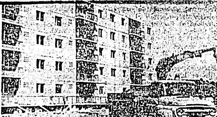
În Calea Aurel Vlaicu, alte blocuri de locuințe vor fi date în curînd în folosința oamenilor muncii.

Creșterea productivității muncii cu peste 3 la sută față de prevederile perioadei a fost principalul factor care a condus la aceste rezultate.