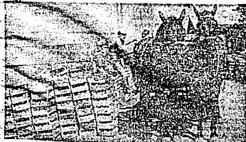
La cooperativa agricolă de producție „Avîntul” din Pecica se folosesc toate mijloacele de transportul legumelor din câmp.

tul orzului pentru masă verde se lucrează la ultimele 10 hectare din suprafața planificată și se continuă însămînțatul orzului pentru boabe, 15 hectare din această cultură primind deja sîmînta. Bine se desfășoară și recoltatul sfeclii de zahăr, aceasta fiind adunată deja de pe aproape 90 de hectare. În același timp se lucrează din plin la arat și pregătirea terenului pentru însămînțările de toamnă.