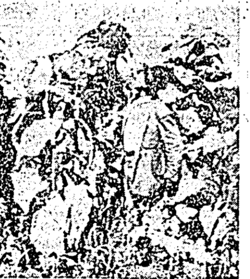
Lotul de hibridare al brigăzii a doua.