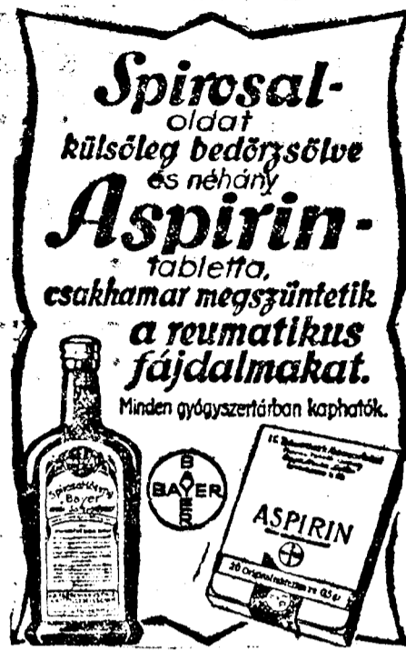
Aspirin egyedülálló a világon!

A túlságosan nagy benzinfogyasztás előidézői: a rosszul záró szelepek, a hiányos olajozás, szoruló csapágyak, vagy fékek, vagy a karburátor túlnagy fuvókája. Ezekon kívül a hibás vezetés és elégtelen gondozás is okozhat túlnagy fogyasztást. Például a motor magas fordulatszámmal való működtetése olyankor, amikor a kocsi igen kis sebességgel halad. Vagy a gázpedál rendszertelen használata, azaz ha valaki ahelyett, hogy egyenletes, fokozatosan erősödő nyomással kezelné a gázpedált, időnként bele-beletapos. Azt sem szabad elfelejteni, hogy a benzinfogyasztás korai mos gyertyánként 20—25 százalékkal növekszik. Az ugynevezett bravuros megállások, azon kívül, hogy balesetet okozhatnak, rongálják a kocsi szerkezetét és a pneumatikokat és fölöslegesen növelik a benzinfogyasztást.