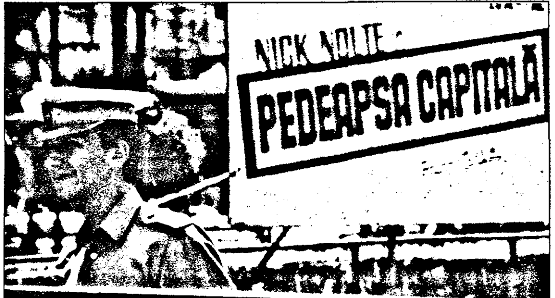
Este vorba de o opțiune. Să procedăm ca politistul din imagine sau nu?