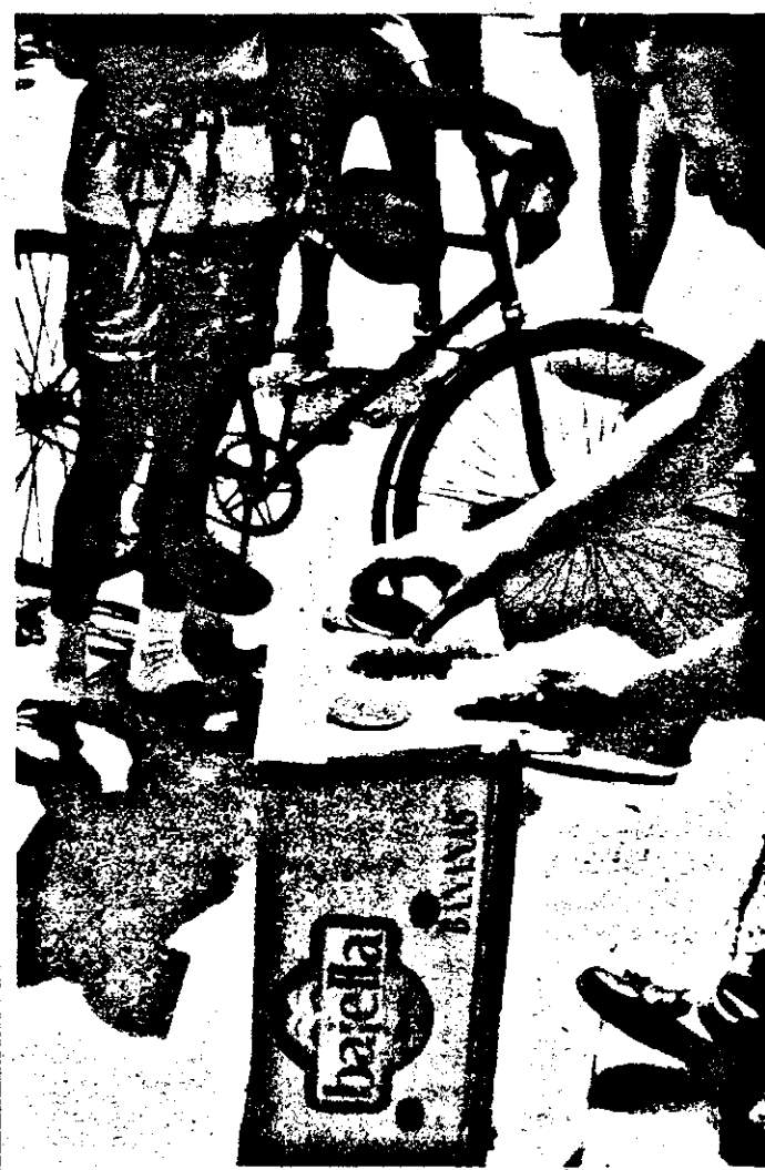
Cum jocurile de intrajutorare au dat faliment, și cum de naivi și creduli nu ducem lipsă, a reapărut în Arad „alba-neagra”. Decamdată, în Piața Fortuna.