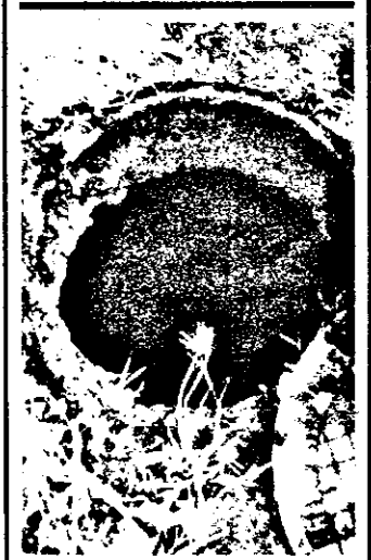
La Blocul A15 (A.Vlaicu) datorită infiltrației, apometrul este inundat.

Pentru amănunte adresați-vă Centrului de sprijin familial și ocrotire a copilului, cu sediul pe str.Gheorghe Lazăr, nr.20, telefon 16553.