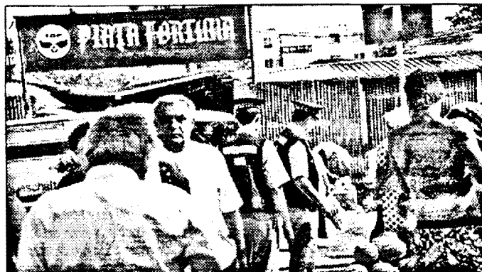
Parcarea de la intrarea în Piața Fortuna dă „peste”, în timp ce gardienii publici puși, chipurile, să păstreze ordinea în parcare, fac mai mult figurăție...