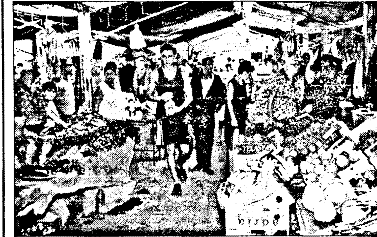
Lume ca într-un furnicar, oameni care se calcă în picioare, dar pe cine interesează asta, deși dl. primar, înainte de a fi ales, a trecut de două ori pe aici promițând că lucrurile se vor schimba. Cum s-au schimbat, se vede.