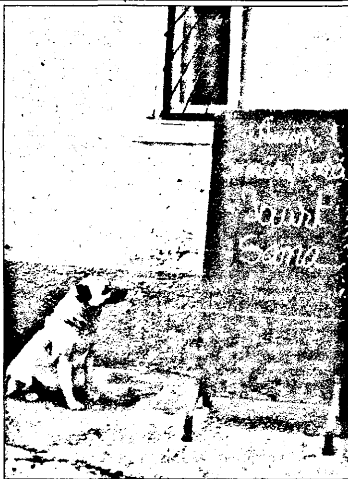
„Uite, dom'le, nici azi n-au adus ciolane!”