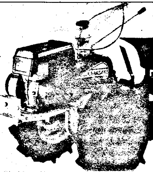
Atât motocultorul, cât mai ales tractorul sunt pentru agricultorul privat utilaje indispensabile. Din păcate, prețurile foarte mari le fac inaccesibile țărănilor, dovedind odată în plus că Guvernul sprijină agricultura mai mult cu promisiuni decât cu bani.