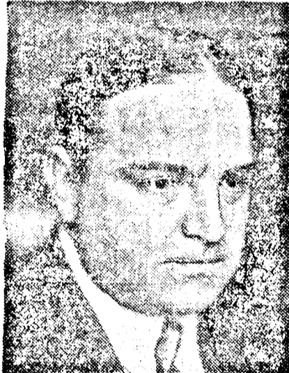
LA GUARDIA newyorki polgármester

Kijelentette, hogy Hitler új világháborút