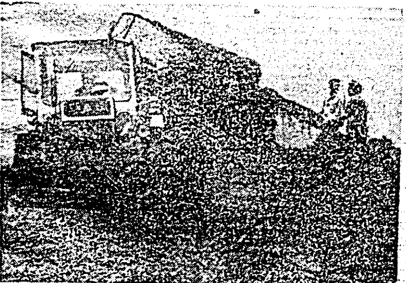
Importantă lucrare de sezon, recoltarea și însilozarea furajelor verzi se desfășoară intens la cooperativa agricolă de producție din Mallat.