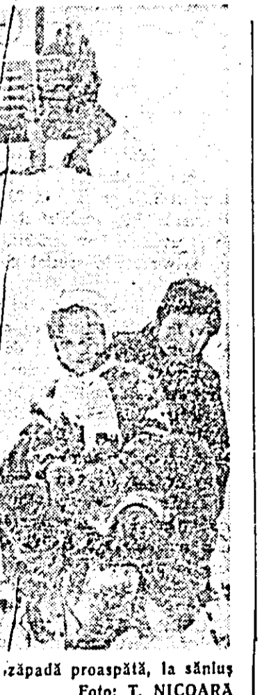
Pe zapadă proaspătă, la sănăș