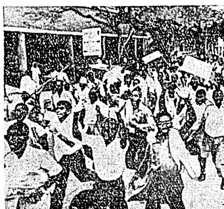
În Tanzania au loc mari demonstrații împotriva declarației unilaterale a independenței Rhodesiei de sud. ÎN FOTOGRAFIE: Aspect de la o demonstrație care a avut loc la Dar es Salaam.

În presa internațională se apreciază, în ultimul timp, că actuala orientare a RFG față de Marea Britanie este determinată de interesele sale militare. Sperînd să pătrundă în clubul nuclear al NATO, guvernul de la Bonn mizează acum într-o măsură și mai mare pe Anglia, considerînd că de ea depinde ca unul din cele două planuri vizînd crearea forțelor nucleare ale NATO să fie puse în practică.