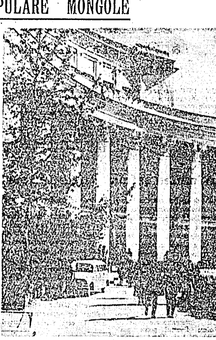
Clădirea Universității de stat din Ulan-Bator

Poporul mongol sărbătorește astăzi împlinirea a 41 de ani de la evenimentul memorabil al istoriei sale — proclamarea Republicii Populare Mongole.