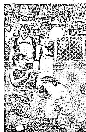
Unul din multele atacuri textiliste. M. CANCIU

Să nu fim greșit înțeles, facem următoarele precizări: arădenii, mai ales în prima repriză, au făcut în timp un joc frumos, uneori de spectacol, cu pase precise, combi-